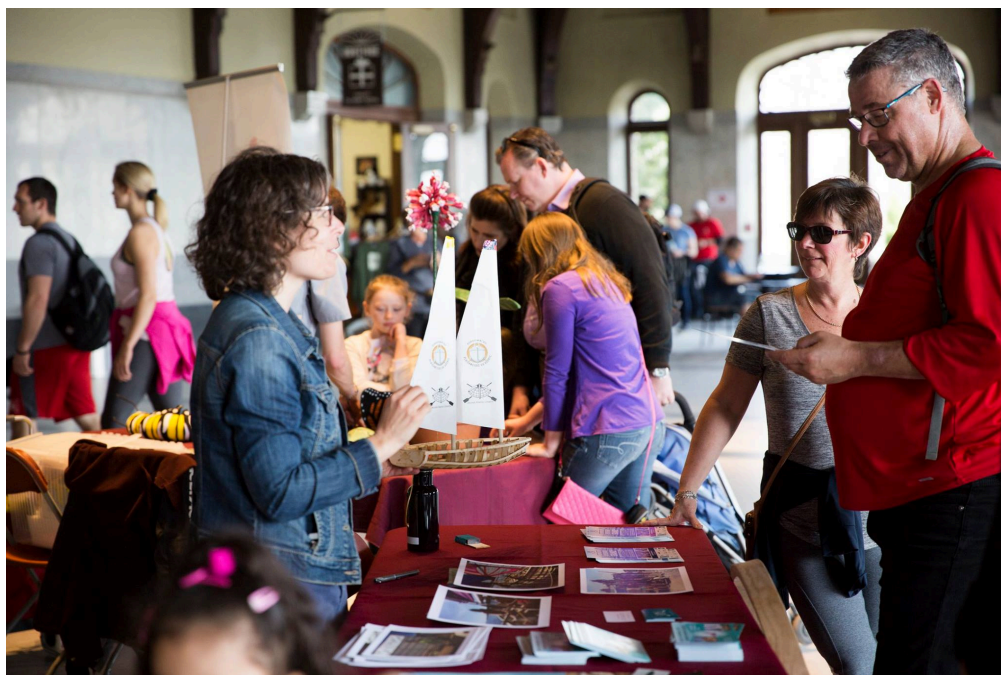
Centre de Loisirs communautaires Lajeunesse / Arr. Villeray, Montréal